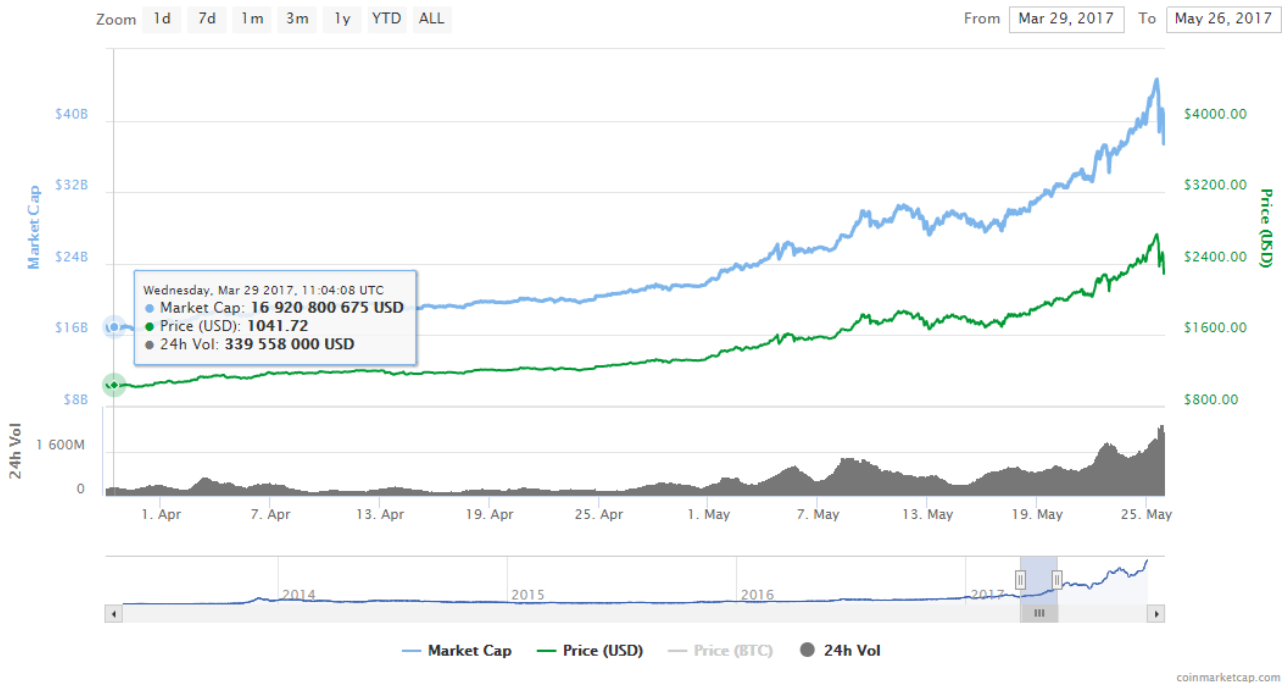
Рис. 1.2. Ціна та капіталізація Bitcoin 29.03.-26.05.2017р. [6]

З серпня 2017 року відбулось кілька знакових подій на ринку Bitcoin, які вплинули на ціну цього активу (див. рис. 1.3.).