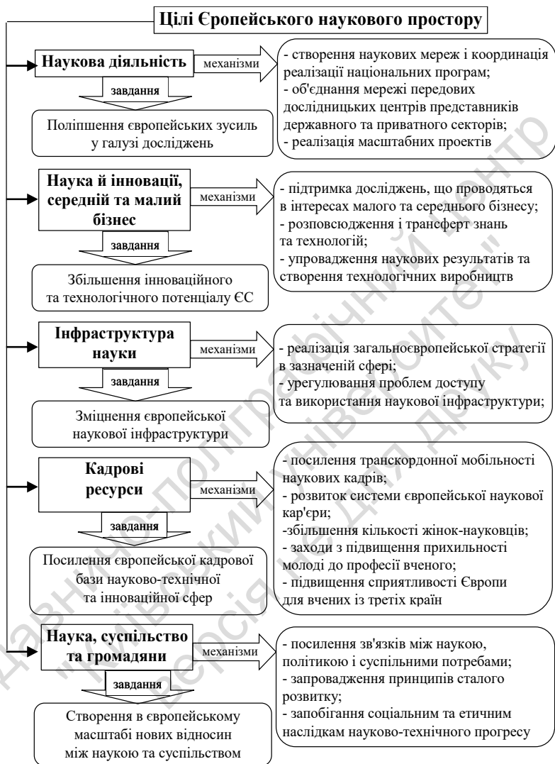
Рис. 2. Основні цілі Європейського наукового простору, завдання та механізми їхньої реалізації [19]

Уже у 2006 р. країнам ЄС-25 вдалося значно поліпшити виконання Лісабонської стратегії. При цьому важливу роль відіграла Сьома рамкова програма ЄС із наукових досліджень